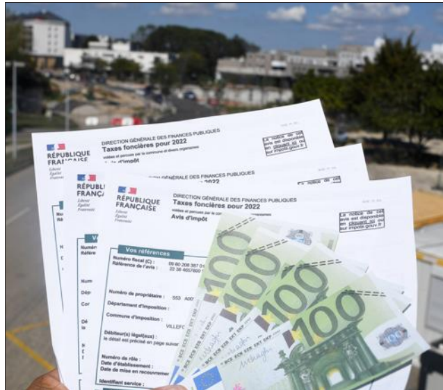
Une large majorité des votants disent ne pas savoir pourquoi la taxe foncière augmente cette année.

Jacquou38 La taxe foncière va augmenter par la volonté du gouvernement de plus de 7 %. Vos élus n'ont pas le choix et ce n'est pas pour se remplir les poches. Vous voulez des pistes cyclables pour quatre individus, des transports en commun pour une dizaine d'autres, eh bien, tout cela à un coût. Chasser la voiture en ville a un coût, il n'y a qu'à demander aux commerçants, qui sont un peu les dindons de la farce. Les propriétaires augmenteront les locations, pour répercuter la hausse de la taxe foncière qui est basée sur le foncier et heureusement pas sur le revenu. Ce dernier est déjà suffisamment taxé.